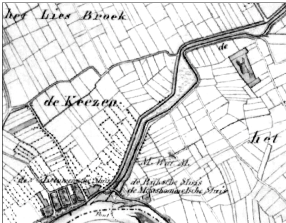
V.l.n.r. de Leeuwense Sluis, de Rijkse Sluis en de Maasbommelse Sluis. Daarboven M.Wat.M (Maasbommelse Watermolen).

Al deze sluisen kunnen alleen maar dienen om water weg te laten stromen. Als in de gouden eeuw bij het droogmaken van de polders in Holland goede resultaten worden bereikt met (wind)watermolens, is er ook al snel sprake van het gebruik van deze molens voor het wegpompen van het overtollige water (b.v. bij Maasbommel).