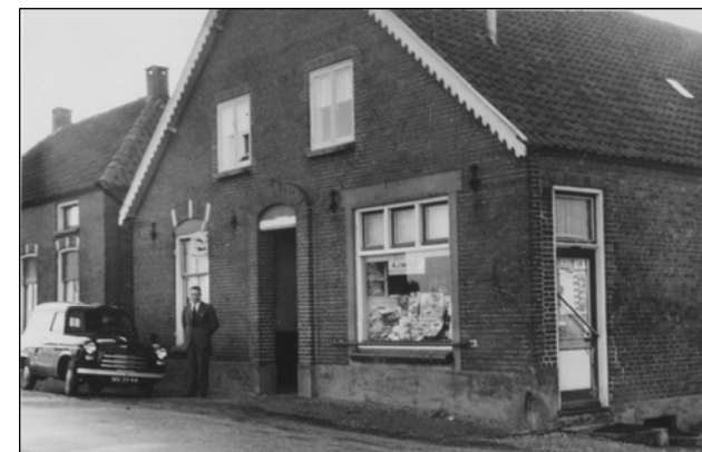
Het winkeltje van Van Erp (nr. 3)

Cub Kuijpers woonde op Greffeling; deze lijst kan waarschijnlijk nog aangevuld worden met winkeltjes aan het Moleneind en op Moordhuizen of elders in het dorp. Wie maakt een aanvulling voor ons?