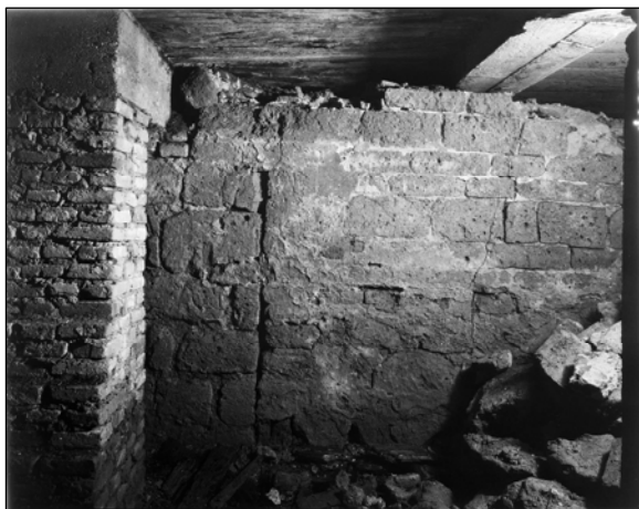
(onderkerk, oudste muurresten)

Wat overblijft zijn de bouwbeginselen van een oud kerkje, bestaande uit pijlers, die mogelijk bedoeld waren om een dak te dragen, en een koor met een halfronde afsluiting. Waar de nissen in dit koorgedeelte voor waren bedoeld is onduidelijk. Waarschijnlijk zullen het geen zitplaatsen zijn geweest, want daarvoor zitten ze te laag. De bouwtijd van koor en schippijlers ligt