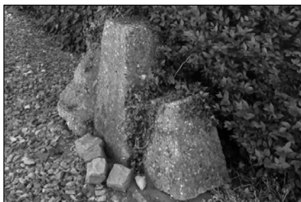
Betonnen fundamenteën waar dit houten gebouw op rustte zijn bewaard gebleven!

't Puikje van Bergonje (de dirigent), zo worden zij daarin genoemd.