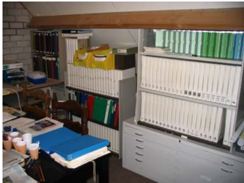
Het begin: de WHAM-zolder

Heel gelukkig waren we in 2007 met het aanbod van dorps huis De Hucht. Een knutselclub die in het dorps huis een grote (inloop)kast had, was gestopt en wij zouden daar onze spullen kunnen opbergen. De aangrenzende ruimte kon op de donderdag worden gebruikt als werkruimte. Onze computer kon, zittend in de kastdeuropening, gebruikt worden. Het was er droog, warm en vooral waren we vanaf dat moment goed bereikbaar!