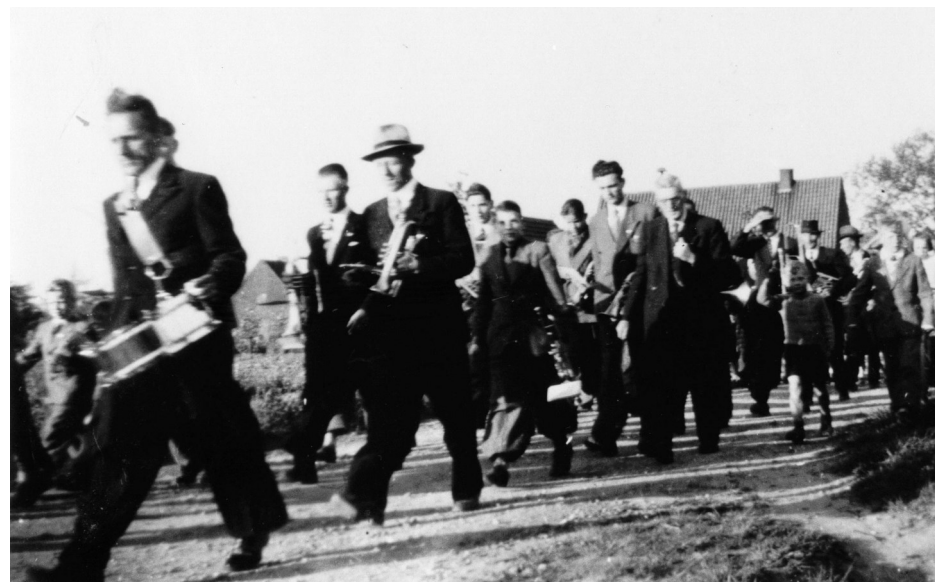
Foto uit 1950 met de muzikanten in hun eigen kleding

1948—2023: Jubileum 75 jaar muziekvereniging St. Lambertus