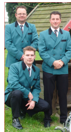
De kleding ging met de tijd mee!